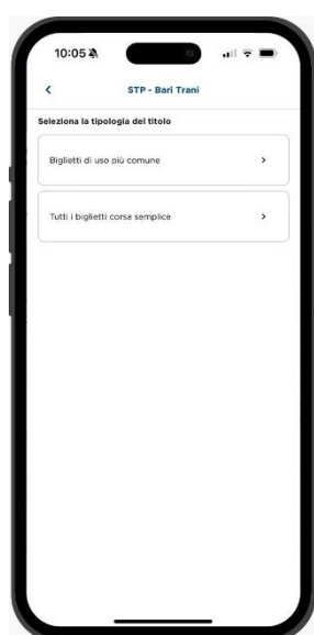
Seleziona Trasporto Pubblico