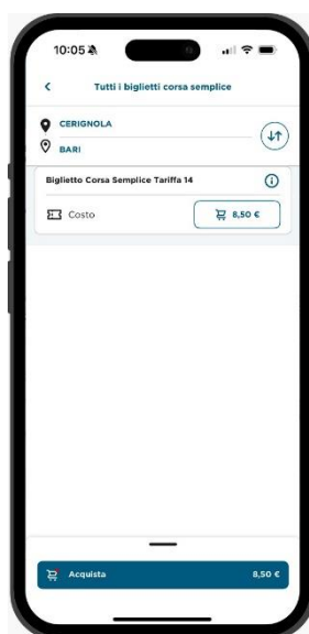
Trova e acquista il titolo di viaggio